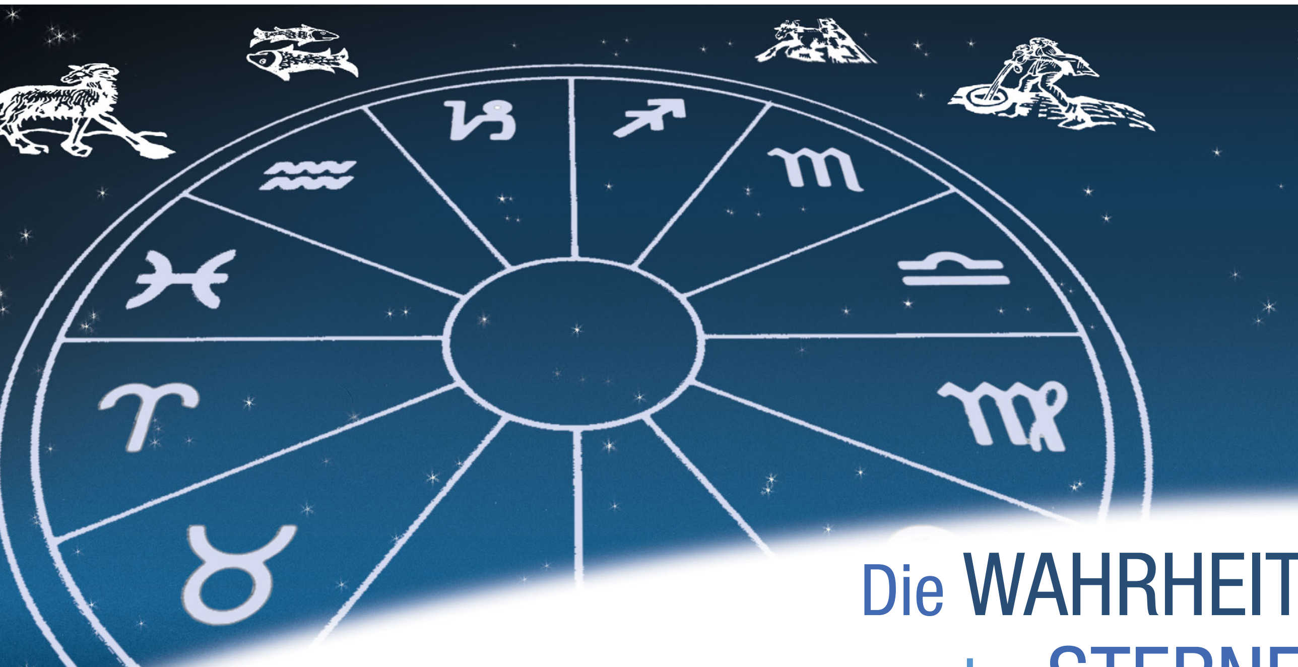
Illustration: Sigrid Frohmann